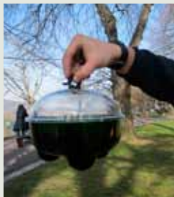
Modelo de trampa comercial