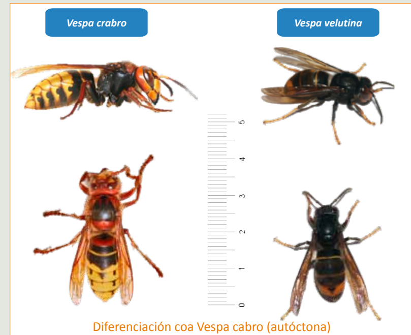
Diferenciación coa Vespa crabro (autóctona)